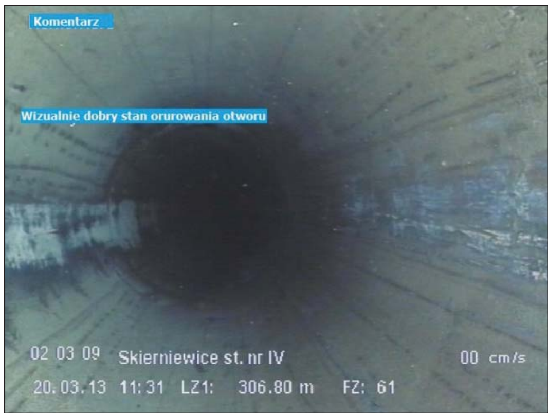
Rysunek 1. Wyniki inspekcji TV – wizualnie dobry stan kolumny rur okładzinowych.