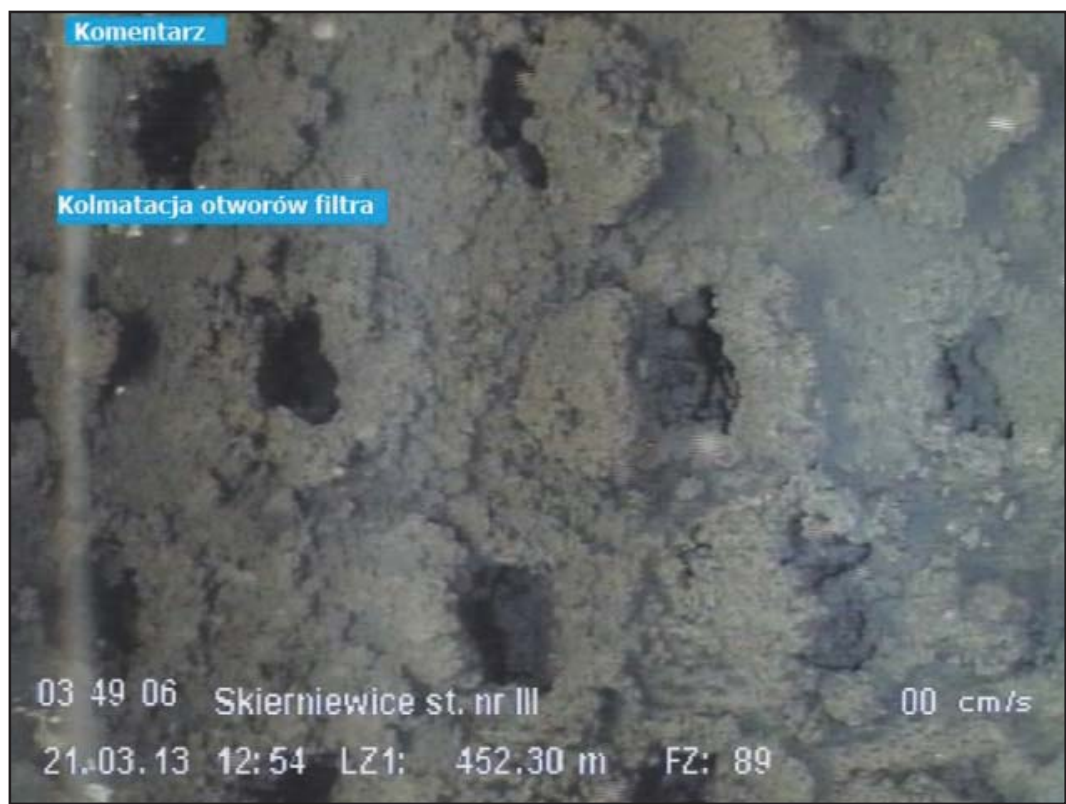
Rysunek 2. Wyniki inspekcji TV – proces kolmatacji filtra w nieeksploatowanej studni nr 3.